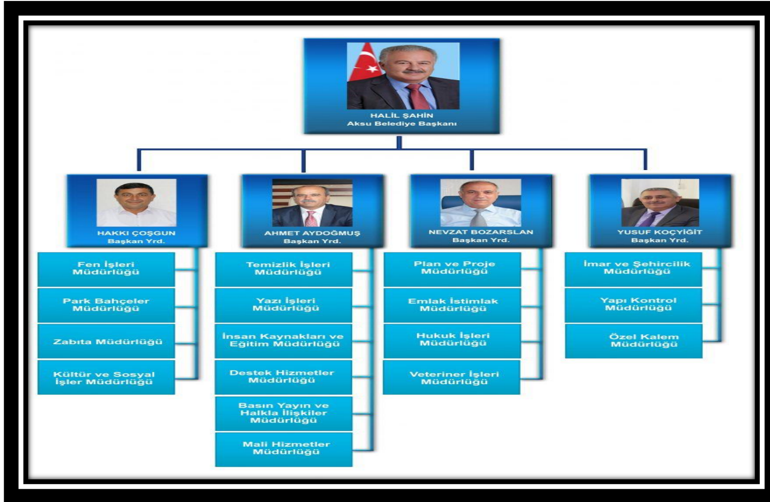
Şekil 2: Aksu Belediye Başkanlığı Teşkilat Şeması