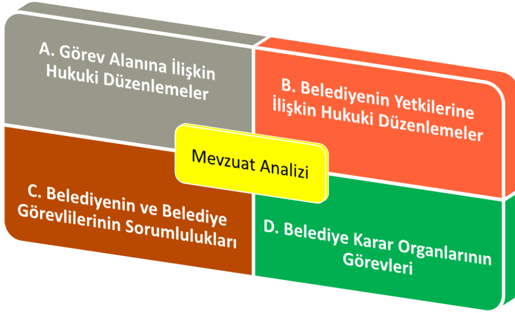
Şekil 1: Mevzuat Analizi